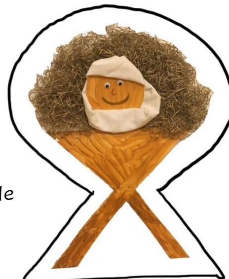
Krippe mit Jesuskind