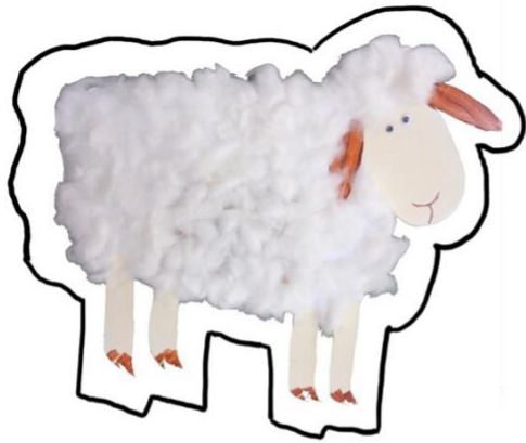
kleines Schaf Willi