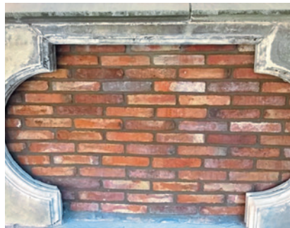
Freileigungsarbeiten förderten Überraschendes zutage.

Der Putz oberhalb des Seiteneingangs wurde von Bauleiter Hille und Herrn Krupa von