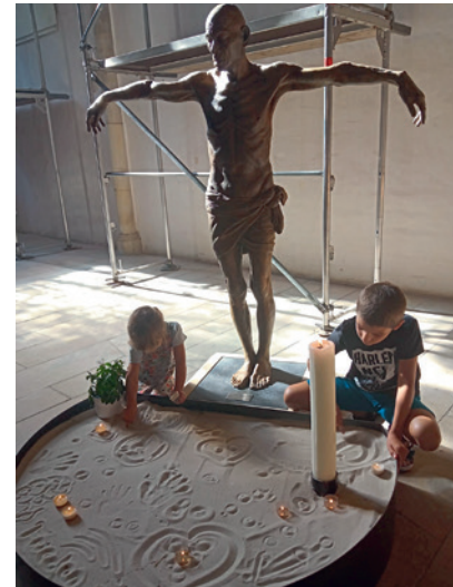
Lotta Blokkers Skulptur „See me“

Kommentar im Rahmen der „Offenen Kirche“